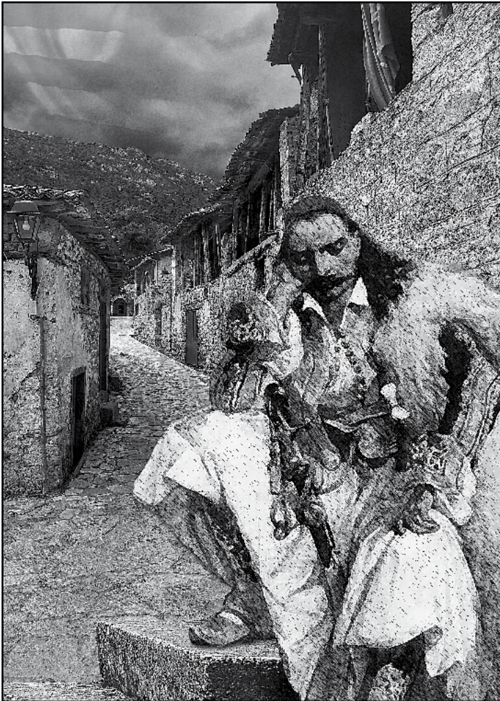
Νίκος Λεοντόπουλος, «Αγωνιστής, 2021», φωτογραφική σύνθεση σε καμβά ζωγραφικής, 60x40 εκ. Από τη διαδικτυακή έκθεση «Η ΕΠΕΤΕΙΟΣ», που παρουσιάστηκε από τις 25 Μαρτίου έως τον Δεκέμβριο του 2021 στην πλατφόρμα 1821.ime.gr του Ιδρύματος Μείζονος Ελληνισμού, επιμέλεια: Τρις Κρητικού.