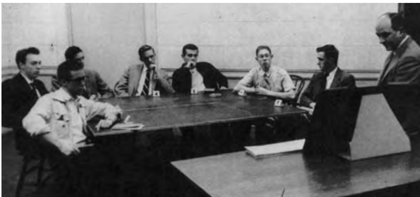
Υποκείμενα που συμμετέχουν σε πείραμα του Asch (το ανυποψίαστο υποκείμενο είναι το έκτο από αριστερά· τα υπόλοιπα άτομα είναι πειραματικοί συνεργοί).

Κάθε μέλος της ομάδας, με τη σειρά, μετά από αίτημα του πειραματιστή ανακοίνωνε δημόσια την κρίση του· η συζήτηση μεταξύ τους δεν επιτρεπόταν. Στην αρχική σειρά πειραμάτων υπήρχαν επτά «συνεργοί» του πειραματιστή και ένα «ανυποψίαστο» υποκείμενο, δηλαδή το μόνο άτομο στην ομάδα που δεν ήξερε ότι οι υπόλοιποι είχαν λάβει την οδηγία να δίνουν τις ίδιες λανθασμένες απαντήσεις μετά το τέλος μερικών αρχικών δοκιμασιών κατά τις οποίες έδιναν τις σωστές απαντήσεις. Το ανυποψίαστο υποκείμενο, λοιπόν, ερχόταν αντιμέτωπο με μια κατάσταση στην οποία βίωνε μια σύγκρουση ανάμεσα στα αντιληπτικά δεδομένα των αισθήσεών του και στις ομόφωνες μαρτυρίες μιας ομάδας ομηλικών.