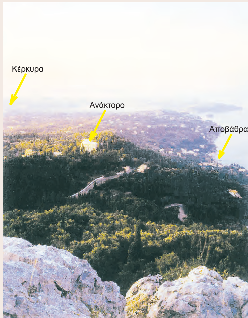
Γενική άποψη της περιοχής όπου βρίσκεται το ανάκτορο του Αχιλλείου.