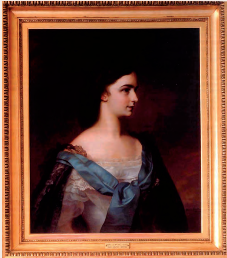
Πορτρέτο της Σίσσυ σε νεαρή ηλικία από το Αχίλλειο. Ο πίνακας είναι αντίγραφο από το πρωτότυπο που βρίσκεται στο Μόναχο. Δωρεά προς το Αχίλλειο του πρώην Νομάρχη Κέρκυρας Αλέξανδρου Πάλλη.