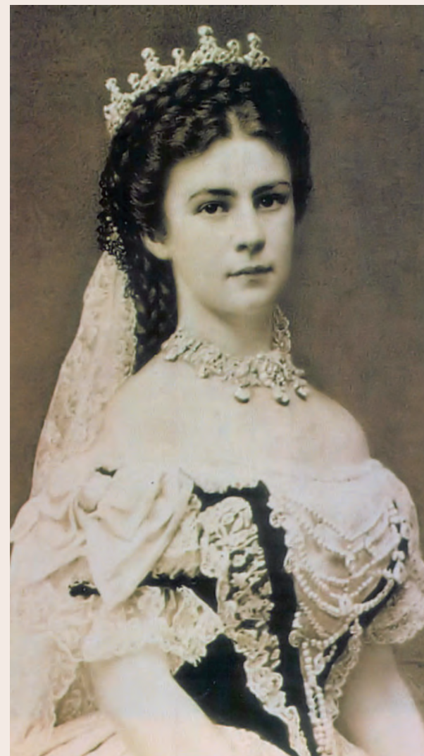
Φωτογραφία της Ελισάβετ την ημέρα της στέψης της ως Αυτοκράτειρας της Ουγγαρίας, 8 Ιουνίου 1867.

και από εκεί μέσω του δάσους στο Μουσείο (όπως συνέβαινε στο παρελθόν με τους αυτοκρατορικούς επισκέπτες).