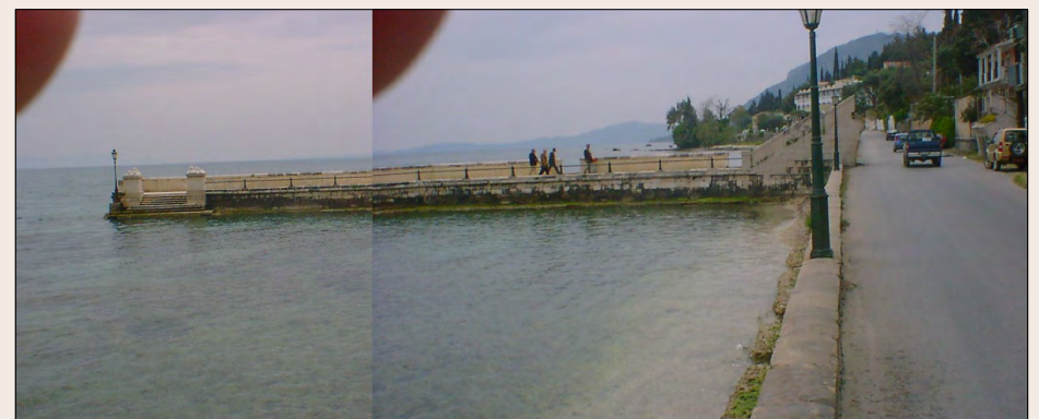
Η αποβάθρα Κάιζερ στην παραλία του Αχιλλείου σήμερα.