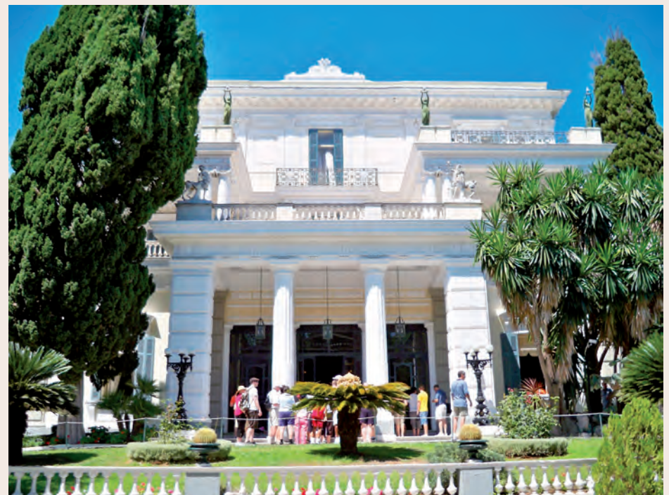
Ανάκτορο, Νότια όψη, κύρια είσοδος.