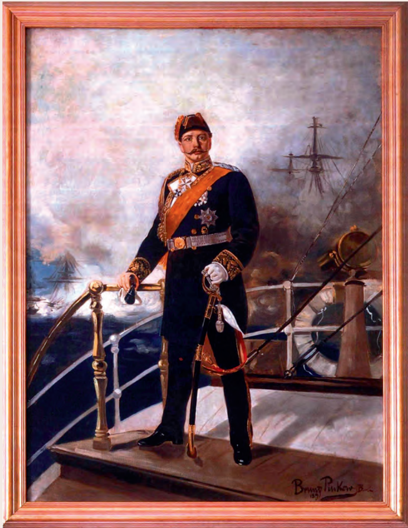
Ελαιογραφία του Αυτοκράτορα (Κάιζερ) Γερμανίας Γουλιέλμου Β΄, όπου απεικονίζεται πάνω στη θαλαμηγό του. Έργο του Bruno Pinkeis, από το Αχίλλειο.