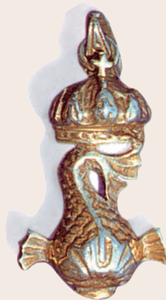
Το έμβλημα που απεικονίζει μία κορόνα και ένα δελφίни κοσμούσε όλα τα αντικείμενα του Αχιλλείου.

Χρειάζεται να καταθέσει ένα κομμάτι από την ψυχή του εκείνος που προσέρχεται να συνομιλήσει μαζί τους, για να του αποκαλύψουν κάτι από την ομορφιά τους, να του αφηγηθούν την ιστορία τους. Αλλιώς, θα παραμείνουν μακρινά και δυσπρόσιτα, θα του χαρίσουν τη φυσική τους παρουσία, αλλά δεν θα του ιστορήσουν την περιπέτεια της ζωής τους.