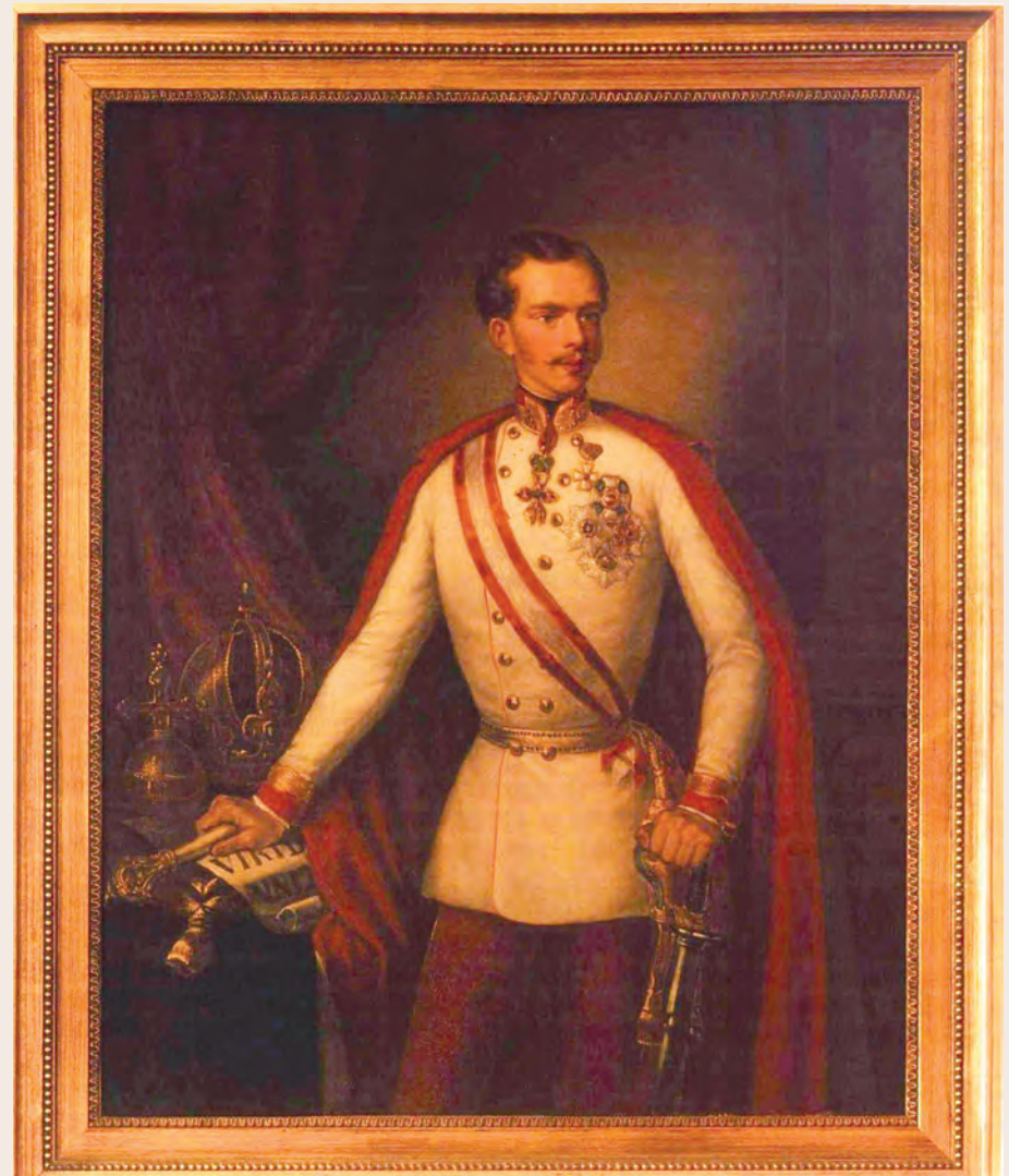
Ο Αυτοκράτορας Φραγκίσκος Ιωσήφ, σύζυγος της Σίσσυ, σε νεαρή ηλικία. Αντίγραφο ελαιογραφίας από το πρωτότυπο που βρίσκεται στο Μουσείο της Βιέννης.